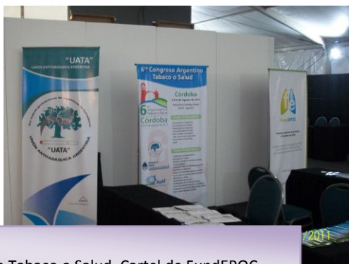
Stand de UATA. Promoción del 6 to Congreso Argentino Tabaco o Salud. Cartel de FundEPOC